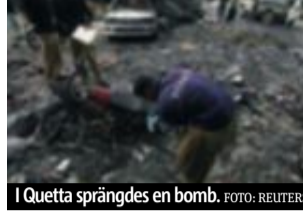
I Quetta sprängdes en bomb.

Det var inne i en trång biljardhall som den förste självmordsbombaren detonerade sin kraftiga sprängladdning. Polis, räddningsarbetare och medier skyndade till platsen och det var då, cirka tio minuter senare, som den andra bomben exploderade.