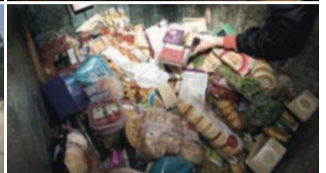
I utvecklingsländer beror svinnet bland annat på långa transporttider på grund av dålig infrastruktur. I västvärlden, däremot, slänger vi gammal mat som fullt ätbar eftersom vi har råd. Maten är en sådan liten del av våra utgifter.