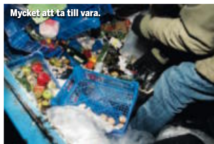
Mycket att ta till vara.