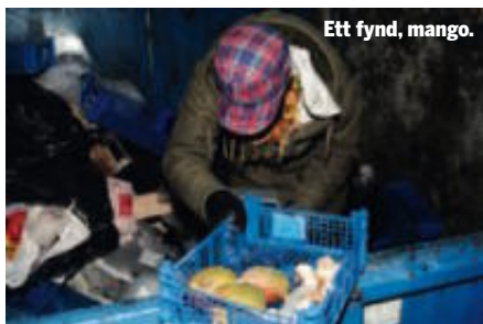
Ett fynd, mango.